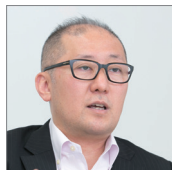
早稲田大学 情報企画部 マネージャー (情報システム担当)