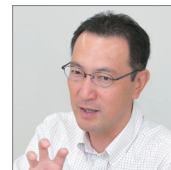
早稲田大学 財務部 財務企画担当課長