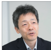
早稲田大学 情報企画部 事務部長