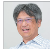
早稲田大学 研究推進部 研究支援課長