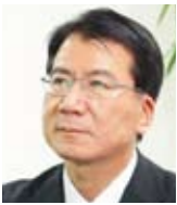
京王電鉄株式会社 総合企画本部 経理部長