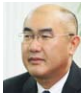
京王電鉄株式会社 総合企画本部 IT戦略部長