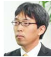
京王電鉄株式会社 総合企画本部 経理部企画担当 課長補佐