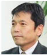
株式会社 京王アカウンティング 取締役社長