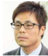
京王電鉄株式会社 総合企画本部 経理部企画担当 課長