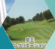
京王 レクリエーション