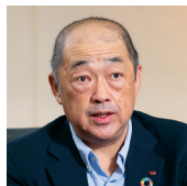
日清食品ホールディングス 株式会社 取締役・CSO 兼 常務執行役員