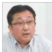
東北電力エナジー トレーディング株式会社 事業管理部長