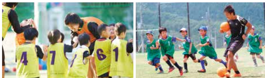
スクールでの練習の様子

HONDA ESTILOでは、今後、一人ひとりのコーチが組織の中での自分の立ち位置を認識して、キャリア形成に役立てていくために、人材マネジメントシステムを活用して行く考えだ。