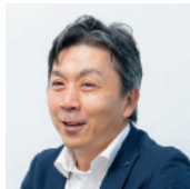
旭化成株式会社 人事部 人事給与サポート室 室長