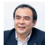
旭化成株式会社 経理・財務部 経理室 単独経営管理グループ グループ長