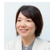
旭化成株式会社 経理・財務部 経理室

「アビームのサポートは非常に強力で、アビームのガイドに従って進めていくことで、ゴールにたどり着くことができました」